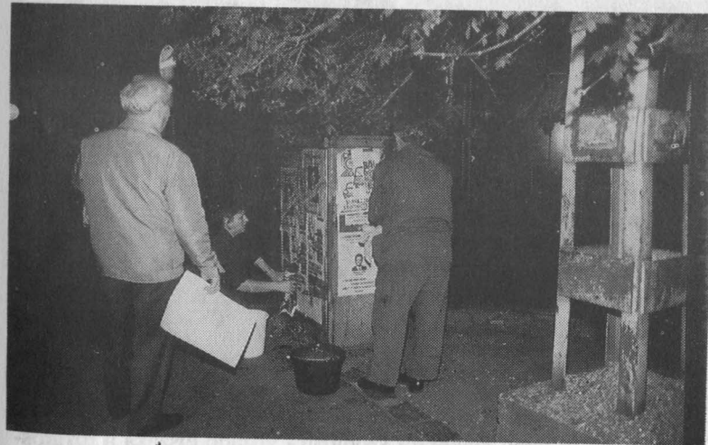
65. Plakát hátán plakát és buzgó aktivisták a választási kampány idején

Pápán a bennünket követő kocsit lemaradt. Talán más állt ránk. Viktor és a felesége bementek a főtéren lakó Kövérek házába, hogy megbeszéljék vele a kialakult helyzetet. Én a kocsiban maradtam, s magamra zártam az ajtót. Arra gondoltam, hogy no lám, a Cég keze... Jó félórát vártam. Eközben ismerős arcok tűntek fel, a helyi fideszesek csoportja. Fél órával jártunk a kampánycsend kitörése előtt, éjjel fél tizenkettő volt. Ügyeltek a Fidesz plakátjaira. Háromnegyed tizenkettkor a főtéren megjelent egy másik kommandó. Az MDF emberei