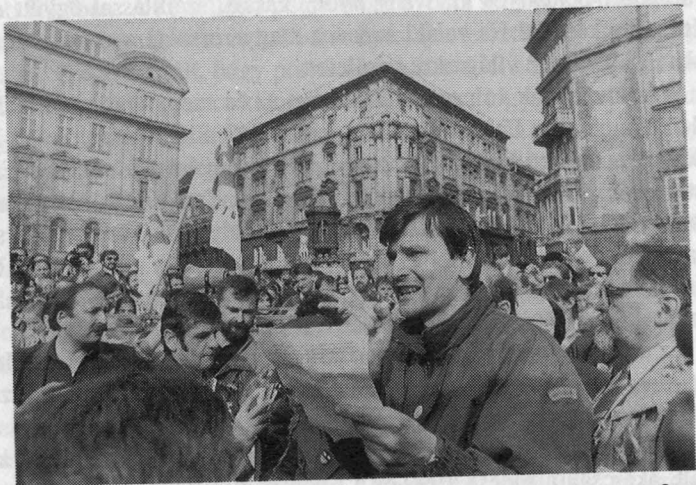
61. 1990. március 15. a Battyhány–Nagy Imre-örökmécsesnél

Március 10-én, azaz a választások első fordulója előtt két héttel a dolgok sínen voltak, legalábbis a Fidesz szempontjából. A kampányapparátus teljes gőzzel működött, s nem volt kétséges, hogy a Fidesz 8-10 százalékos listás eredményt érhet el. Naponta, szerte az egész