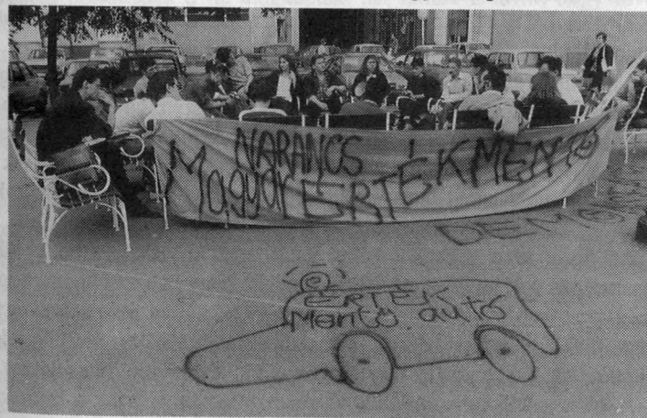
60.: A Magyar Narancs értékmentő fóruma a kampány idején, Budapest, József Nádor tér

A Magyar Narancs ment a maga útján. A lap szerkesztőinek több mint fele aktívan közreműködött a Fidesz választási kampányában mint szövívő, sajtófőnök, kreatívteam tag. S ez vonatkozott a cikkek íróinak egy részére is. Sőt! A Magyar Narancs olvasói estjei ez időben nemegyszer átalakultak fideszes választási gyűlésekké. A lap látszólag komplett pártorgánummá vált. S valójában mégsem így volt. Amikor ugyanis szerkesztőségi megbeszélést tartottunk, akkor tudatosan arra törekedtünk, hogy függetlenítsük magunkat a Fidesztől s annak napi politikai érdekeitől. Igyekezetünket a kissé skizofrén helyzetben többkevesebb siker koronázta. Az újság színvonala egyre emelkedett, mind többen olvasták a Narancsot. A lap a választások idején ért zenitjére. Valamiféle parttalan energiával – számos egyéb napi feladat mellett –