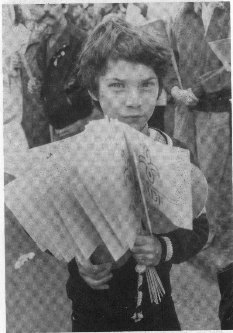
62. 1990. március 15-e Budapest belvárosában

után, a budapesti Hősök terén spontán tömegtüntetés volt a marosvásárhelyi téboly miatt. Újra a Hősök terén, újra Erdély miatt, s újra a tehetetlenebbnél is tehetetlenebbül. Torokszorító érzés volt. A tömeghez a különféle pártok képviselői szóltak. Volt, aki okosan és szépen beszélt, mások viszont egy választási nagygyűlés stílusában ágáltak. Három különösen kirívó szónoklatot külön is megjegyeztem magamnak. Tamás Gáspár Miklós, aki kolozsvári származékként is szólt, a határok végső elismerését ígerte Romániának cserébe azért, ha a románok végre tiszteletben tartják az ottani magyarság jogait. Régóta érvényben lévő határokat azonban ily módon és ebben a helyzetben így megerősíteni egykönnyen olaj lehetett a tűzre a határ túloldalán. Kónya Imre beszéde éles, végvári vitézeket megszegyenítő hangnemével tűnt ki. Az a dr. Kónya, aki még néhány héttel korábban is mint a Független Jogász Fórum higgadt fejű vezetője volt ismeretes, hirtelen nagyszavú MDF-es pártemberként tűnt fel. A legsajnálatosabb azonban mégis Keresztes K. Sándornak, a kereszténydemokraták vezetőjének a megszólalása volt. Marosvásárhely kapcsán szabályos választási szónoklatot rögtönzött, a végéről jószerével még az sem hiányzott, hogy lám, ezért is pártjára kell szavazni. A több tízezres tömeg nagy része kifütyülte.