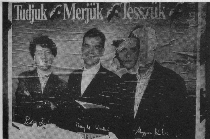
66. Választási kampány-fínis: plakát hátán plakát, az SZDSZ-éhez aláírási-javaslat: Hurrá! Nyaralunk!