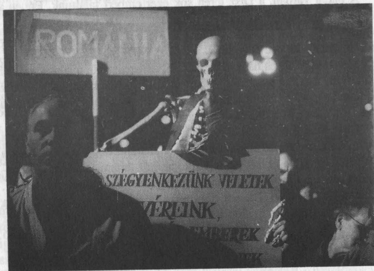
64. A budapesti reakció: tüntetés a Hősök terén

A választási kampány a Fidesz számára is az utolsó hetébe lépett. A fiatal demokraták tudták, hogy az ő szempontjukból az első forduló a lényeges, a listás szavazatokban reménykedhettek csak, egyéni jelöltek terén egyelőre még nem vehették fel a versenyt a többi párttal. Éppen ezért az utolsó héten a Fidesz csak egyet tartott szem előtt: semmi olyat nem tenni, nem mondani, ami kifogásolható, és az utolsó pillanatban a Fidesz ellen fordítható.