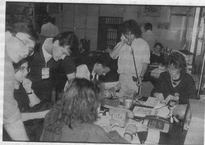
68. A Fidesz választási kampányközpontjában március 26-án reggel

Összecihelődtem, és elindultam aludni. Gyalogosan dülöngéltem a néptelen reggeli utcákon, s arra gondoltam, hogy ez diadal, érdemes