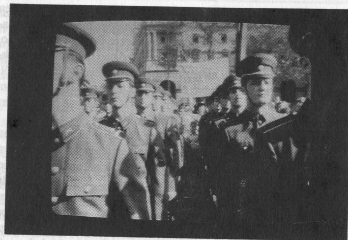
43. 1989. október 23. Délben a Parlament előtt, a háttérben felirat: Villák proletárijai, mi lesz veletek?

A Jereván–Leninán–Szipitak túráról október 22-én este kerültünk elő. Éppen időben ahhoz, hogy részt vegyünk az első szabadon meg- ünnepeelt október 23-án. Érdemes volt. A napnak két kiemelkedően fontos eseménye ígérkezett. Mindkettő a Parlament előtt. Délben Szű-