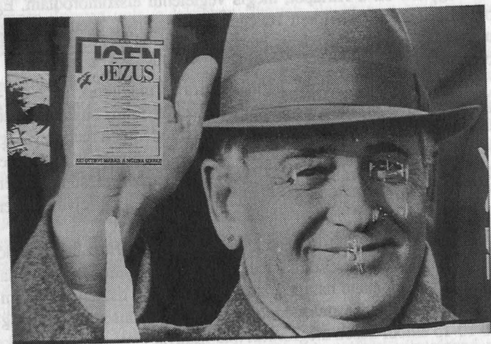
44. Gorbacsov, Jézus és a „4 igenes” népszavazás plakátja

Karabah után csak szusszanásnyi idő telt el, s beköszöntött a szelíd forradalom Prágában. November végére azután nemcsak Havelék győztek, hanem Magyarországon is győzött a „4 igen”. Ezzel elhárult