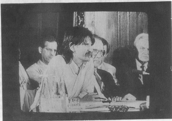
21. A slusszpoén: Kövér László (Fidesz) bejelenti, vannak, akik nem írják alá a paktumot

1989. szeptember 18-án este a kamerák keresztüztüében a felek aláírták a nemzeti kerekasztal-tárgyalások első és egyben utolsó dokumentumát. A hangulat meglehetősen felemás volt. Néhány perccel korábban jelentette be ugyanis Kövér László, hogy az EKA négy résztvevője, a Fidesz, a Független Szakszervezetek Demokratikus Ligája, az