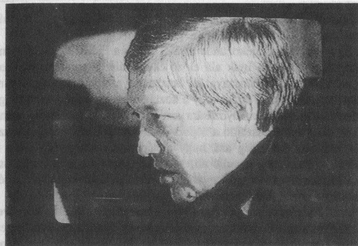
22. S aki találva érezte magát: Pozsgay Imre levegőt vesz a válaszhoz

SZDSZ és a Szociáldemokrata Párt nem írják alá a megegyezést, de nem is vétőzzák meg. Pozsgay Imre pontosan értette, miről van szó. Először elsápadt, azután elvörösödött, és amúgy igen méltóságteljesre formált szerepéhez méltatlanul igencsak ingerülten reagált. S tette mindezt az árulkodó tévékamerák előtt, élő, egyenes adásban! Nagy hiba volt. Ez a hangulat ugyanis azután némi árnyékot vetett az aláírás ünnepinek szánt ceremóniájára. Pedig hogy csattogtak a vakuk, mily bizakodva néztek egymásra az aláíró felek!